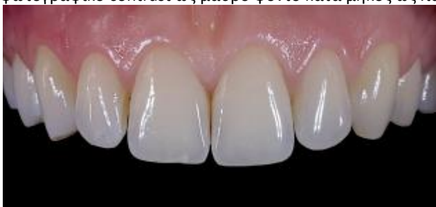
Πλευρικά Led φωτισμού

Η λήψη της φωτογραφίας στα αριστερά έγινε με τη χρήση κεντρικών Led φωτισμού, με μέγιστη ισχύ (με σβησμένα τα πλευρικά Led). Το αποτέλεσμα είναι το ίδιο μ' αυτό που θα είχε επιτευχθεί με τη χρήση περιμετρικού φλας. Χρησιμοποιήθηκε φωτογραφικό contrast ως μαύρο φόντο κατά μήκος ως παρειοκάτοχο.