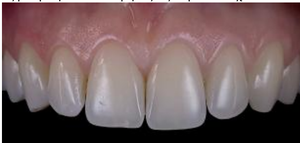
Εικόνα με διαθλατήρες

Εδώ χρησιμοποιήθηκαν πλευρικά Led φωτισμού (αριστερά και δεξιά) με μέγιστη ισχύ (με σβησμένα τα κεντρικά Led). Το αποτέλεσμα είναι το ίδιο μ' αυτό που θα είχε επιτευχθεί με τη χρήση διπλού φλας. Χρησιμοποιήθηκε φωτογραφικό contrast ως μαύρο φόντο κατά μήκος ως παρειοκάτοχο.