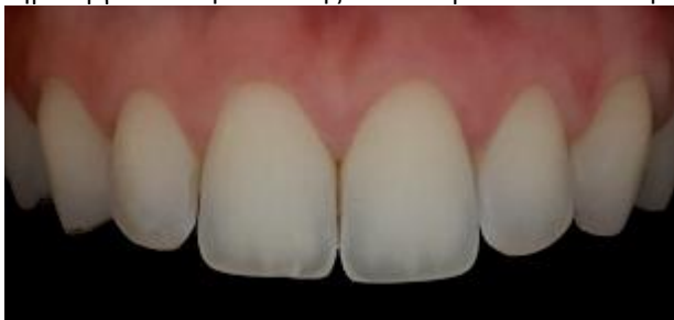
Εικόνα με φίλτρο πόλωσης

Η λήψη της φωτογραφίας έγινε με κεντρικά Led, με μέγιστη ισχύ, με τους διαθλατήρες αναμμένους (με σβησμένα τα κεντρικά Led). Χρησιμοποιήθηκε φωτογραφικό contrast ως μαύρο φόντο κατά μήκος ως παρειοκάτοχο. Το φως των διαθλατήρων δημιουργεί ένα εφέ σκίασης που επιτρέπει να δείτε τη δομή της επιφάνειας των δοντιών και των ούλων.