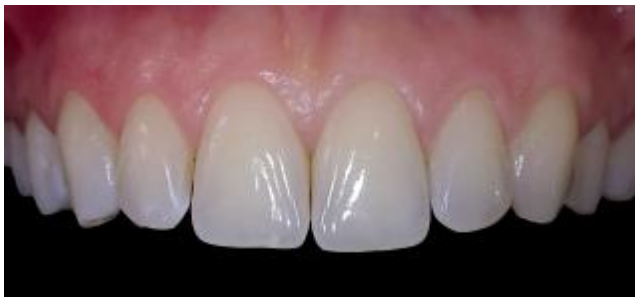
Κεντρικά Led φωτισμού

Φωτογραφίες, χωρίς ρετούς, τραβηγμένες με smartphone + Smile Lite MDP